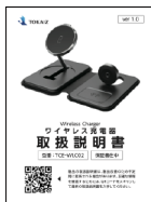
取扱説明書& 保証書(本書) × 1