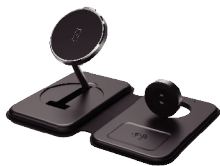
本体 × 1