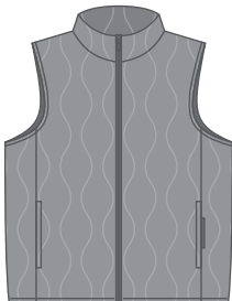
ハイカラータイプ