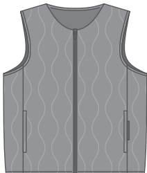
ノーカラータイプ